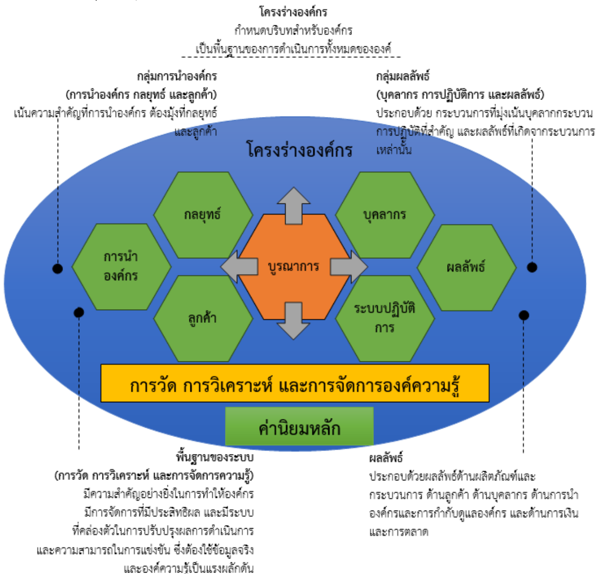
แผนภูมิที่ 5 ระบบการปรับปรุงผลการดำเนินงาน

คณะบริหารธุรกิจและนิเทศศาสตร์ ใช้เกณฑ์ EdPEX และ PDCA ในการขับเคลื่อนองค์กรให้มีการพัฒนา และกำหนดแผนยุทธศาสตร์การพัฒนาคณะบริหารธุรกิจและนิเทศศาสตร์ โดยมีการใช้เครื่องมือด้านการหลักสูตรและบริการ เช่น Gap Analysis , AUN-QA