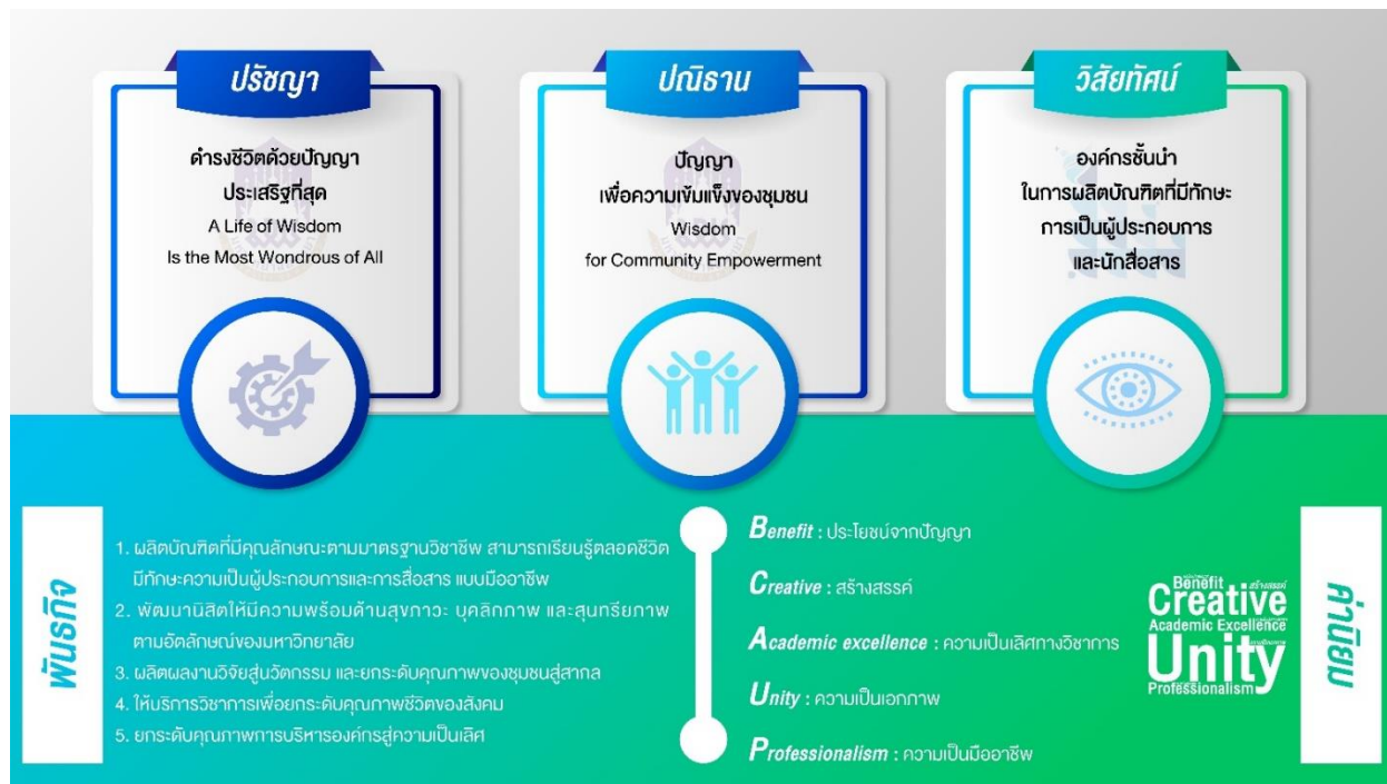
ภาพที่ 1 ปรัชญา ปณิธาน วิสัยทัศน์ พันธกิจ ค่านิยมร่วม สมรรถนะหลักและอัตลักษณ์บัณฑิต คณะบริหารธุรกิจและนิเทศศาสตร์