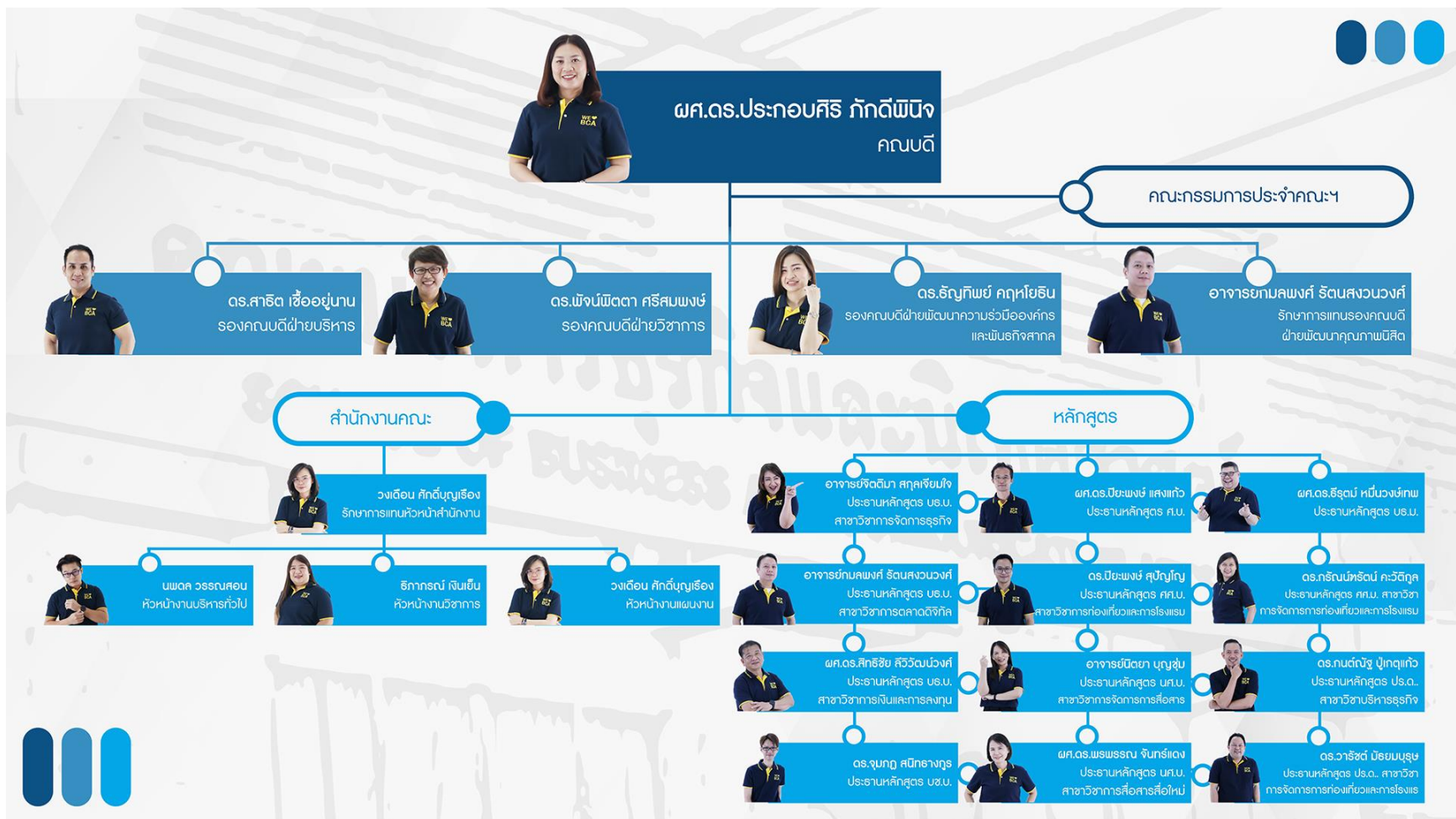
แผนภูมิที่ 4 โครงสร้างการบริหารงาน